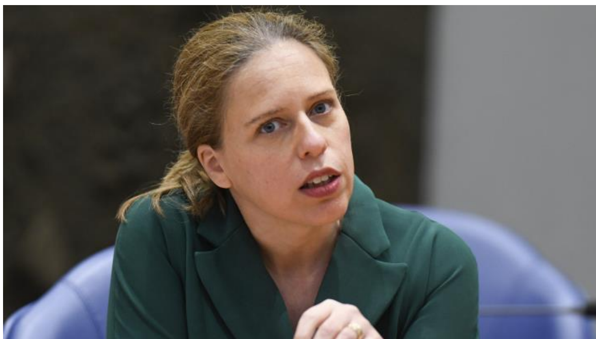
Minister Schouten in de Tweede Kamer

Deze financiële hulp moeten gemeenten minimaal bieden.