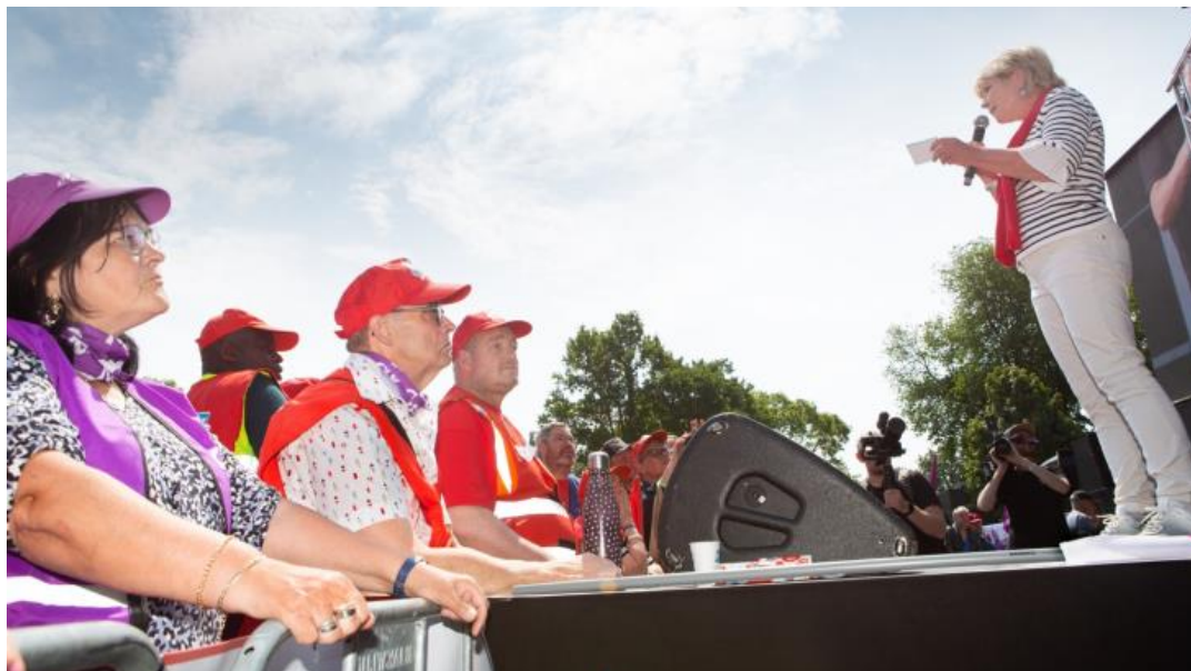
Een demonstratie eerder dit jaar

Medewerkers van sociale werkvoorzieningen gaan erop vooruit.