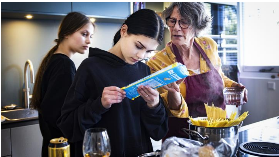
Oekraïense vluchtelingen bij Nederlands gastgezin.

Het logeren bij een gastgezin kan onderdeel worden van het inburgeringsaanbod.