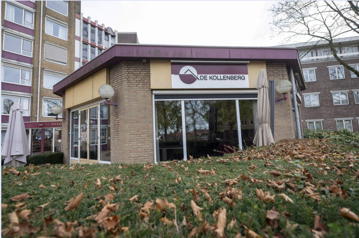
Zorgcentrum Huize De Kollenberg.

Door: Paul Dolhain verslaggever Sittard-Geleen dagblad de Limburger 2 april 2026